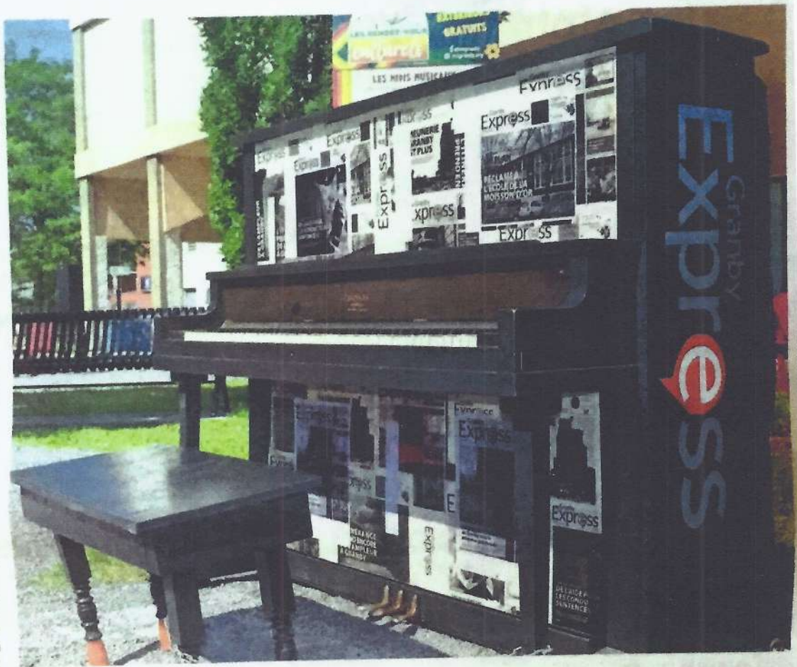
Sur la photo, l'équipe de l'Atelier 19 en pleine création artistique au skate park de Granby.

Dans les prochaines années, la murale au Centre culturel France-