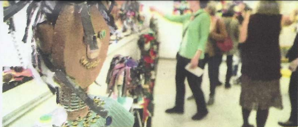
L'Atelier 19 expose 300 œuvres réalisées dans le cadre de ses programmes destinés à la jeunesse.

PREMIÈRE EXPOSITION DES ŒUVRES DE SES ARTISTES