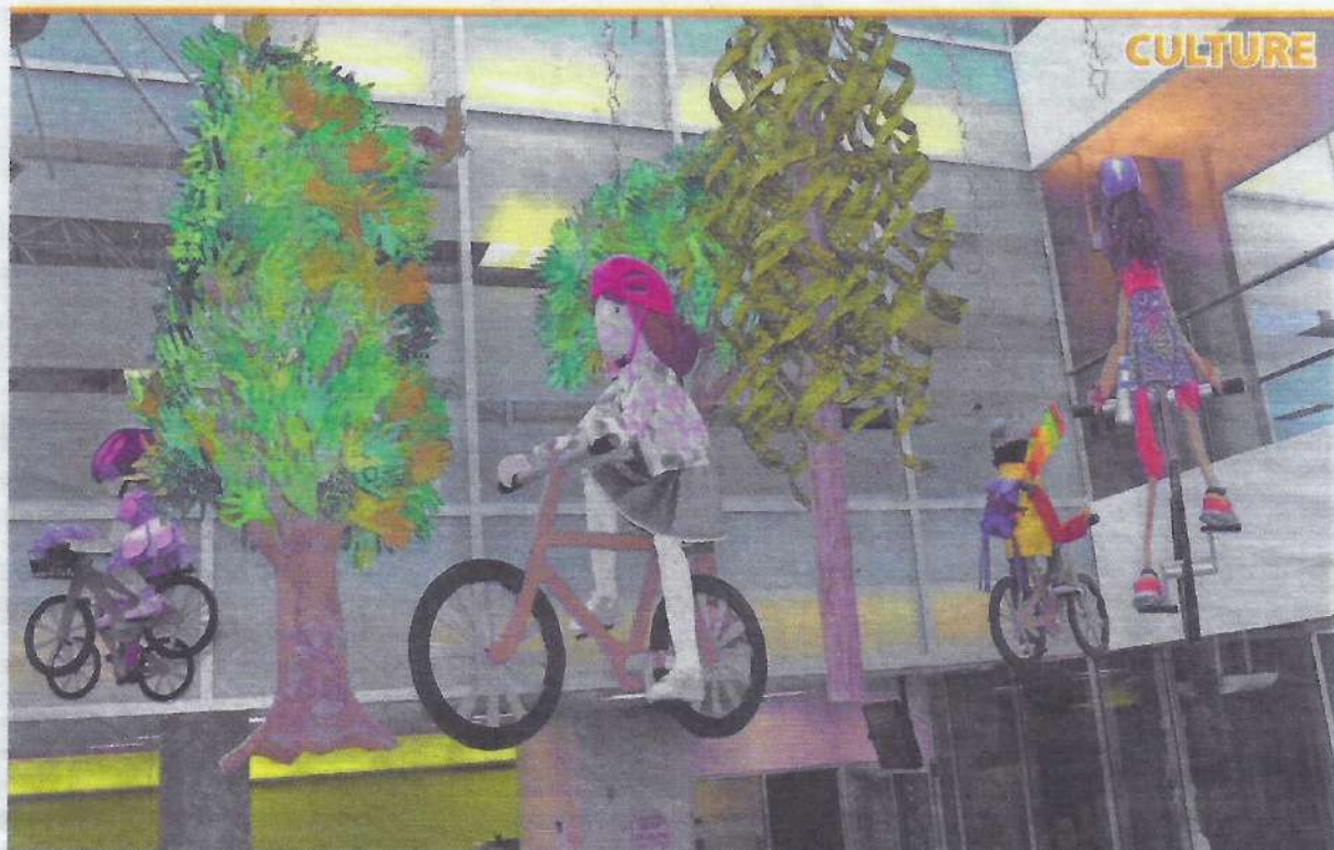
Durant les six prochains mois, l'oeuvre «Vélo et nature» sera exposée à la Caisse Desjardins de Granby.