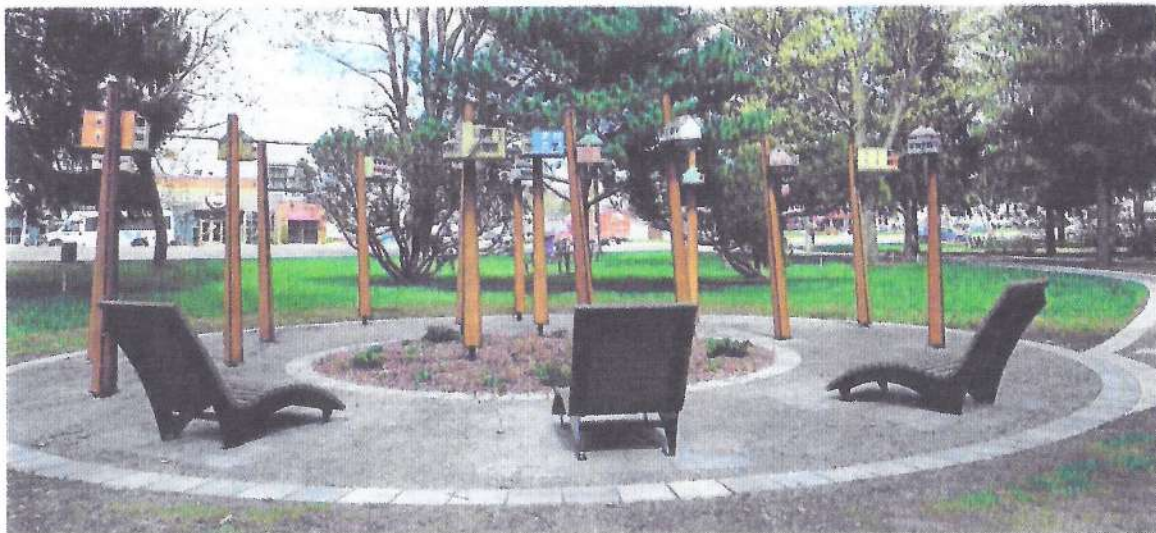
La thématique des oiseaux a été exploitée dans le parc, comme cet flot coloré de maisonnettes d'oiseau, fabriquées par l'Atelier 19.

Au final, la nouvelle allure du parc Pelletier aura valu l'attente, croit Pascal Bonin. « J'ai été patient. J'ai ramassé de l'argent durant deux budgets, c'est-à-dire deux fois 300 000 $ pour ce projet-là », conclut le maire.