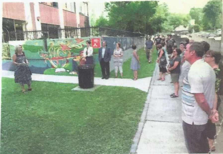
La nouvelle murale à ciel ouvert a été inaugurée lundi matin. L'œuvre, créée par l'Atelier 19, ses artistes et bénévoles, enjolive les murs de la terrasse de la bibliothèque Paul-O.-Trépanier de Granby.