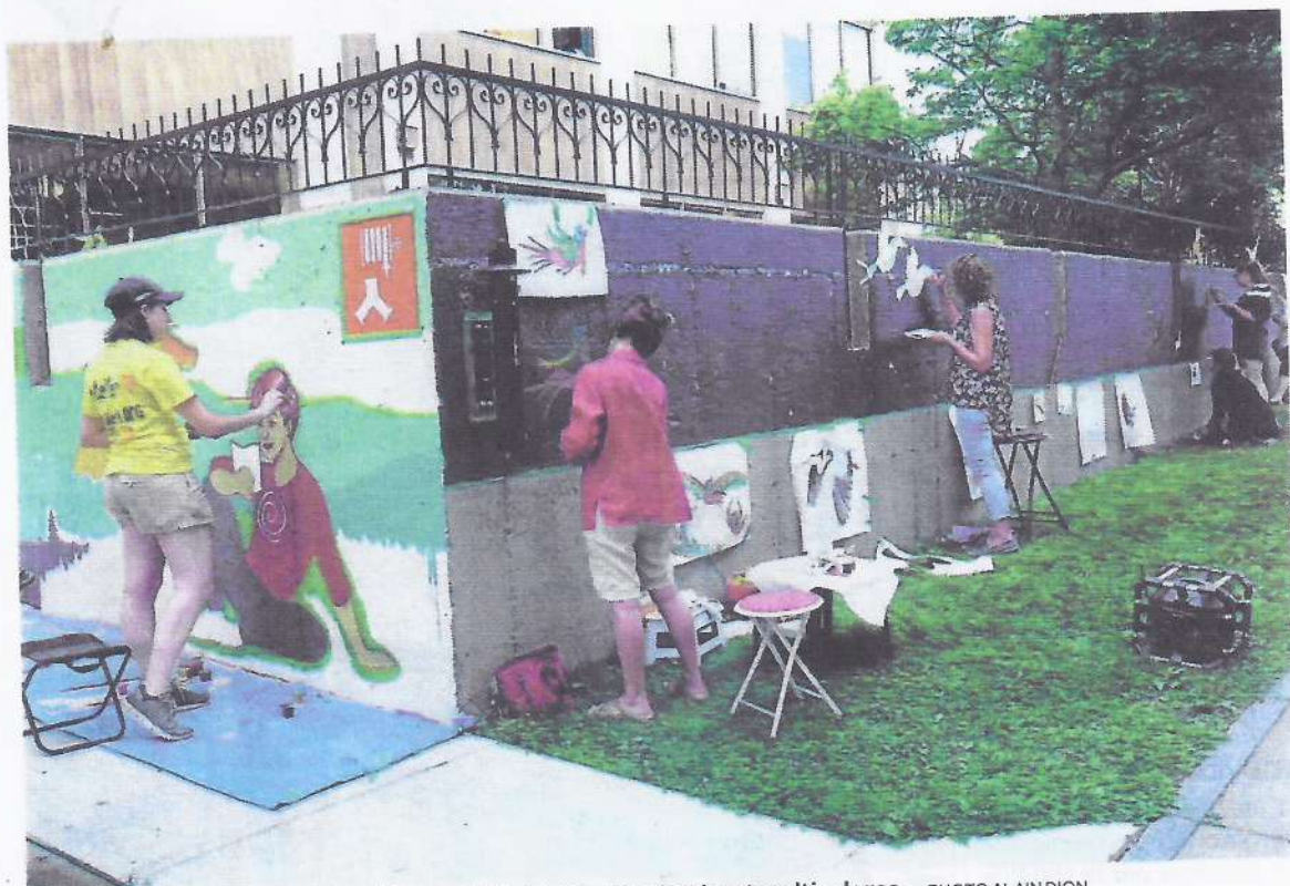
De gris terne, les trois faces extérieures de la terrasse deviendront multicolores.